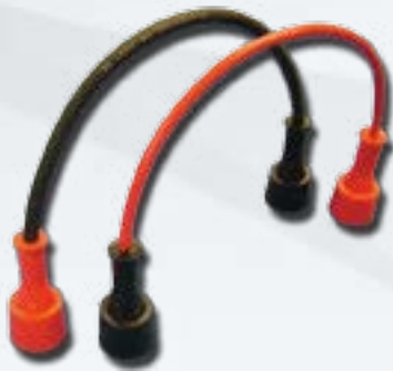
Ladekabel für DIN-Pol T-Typ Charging Cable for DIN-Pol T-Typ