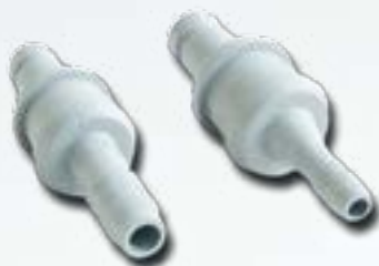
Stecker für Wasser Male Coupling for Water