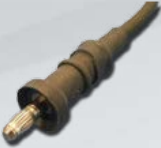
Ladekabel für Innengewinde Charging Cable for Female Thread