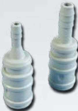
Kupplung für Wasser Female Coupling for Water