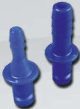
Stecker für Luft Male Coupling for Air