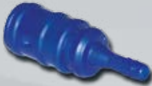
Kupplung für Luft Female Coupling for Air