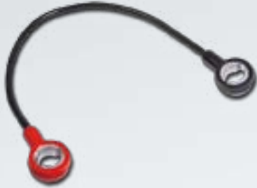
Ladekabel für DIN-Pol S-Typ Charging Cable for DIN-Pol S-Typ